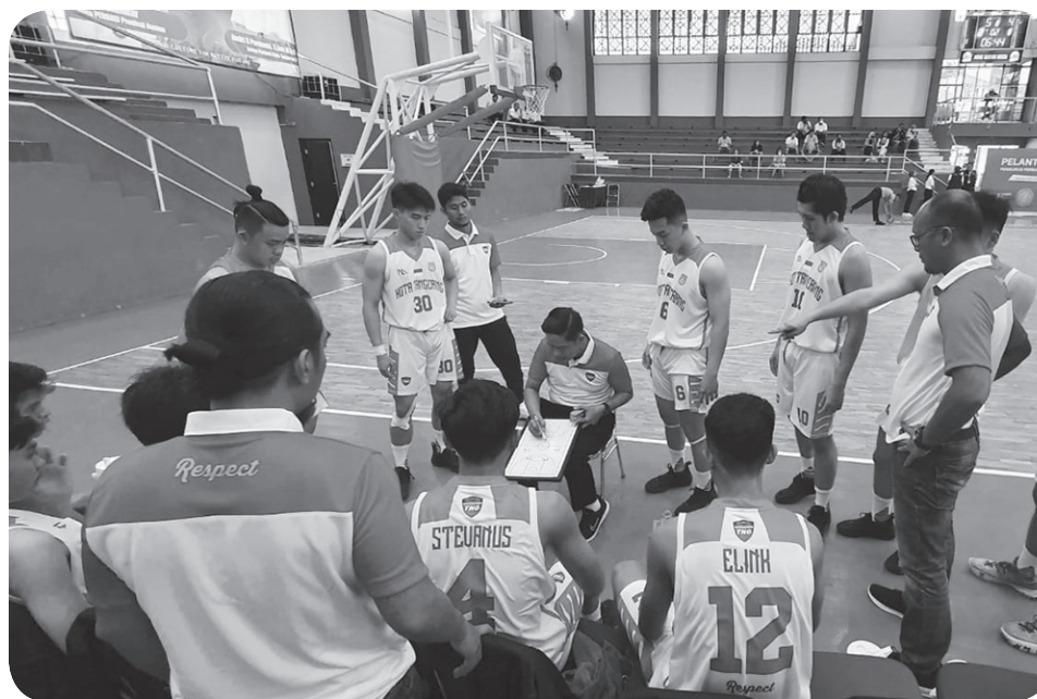
Tim bola basket Kota Tangerang, saat diberi pengarahan oleh pelatih.

“Target kita emas, juara umum baik putra dan putri maupun kategori 3x3. Mudah-mudahan dengan usaha dan doa semuanya bisa tercapai,” tutupnya. ● joh